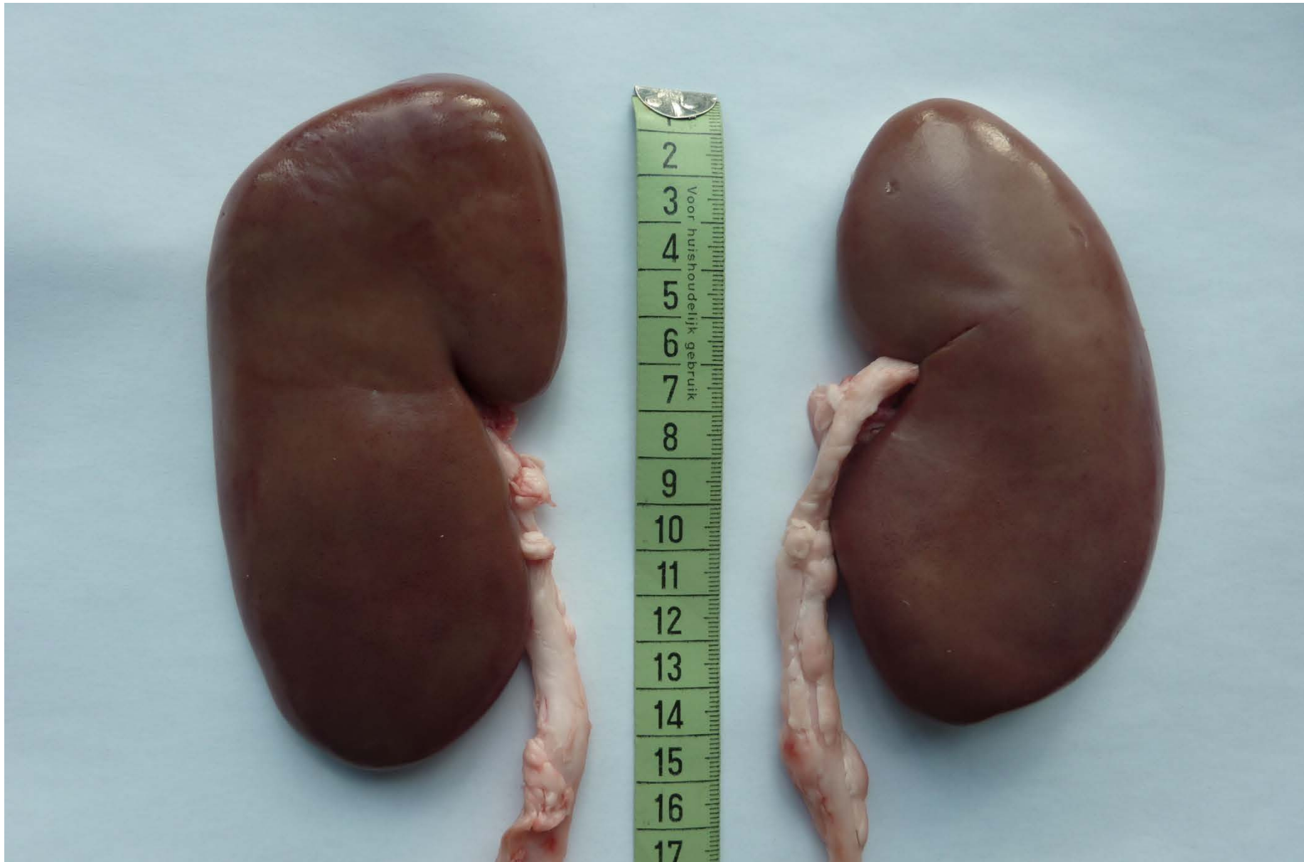
Bild: paarig angelegte Nieren mit Harnleiter