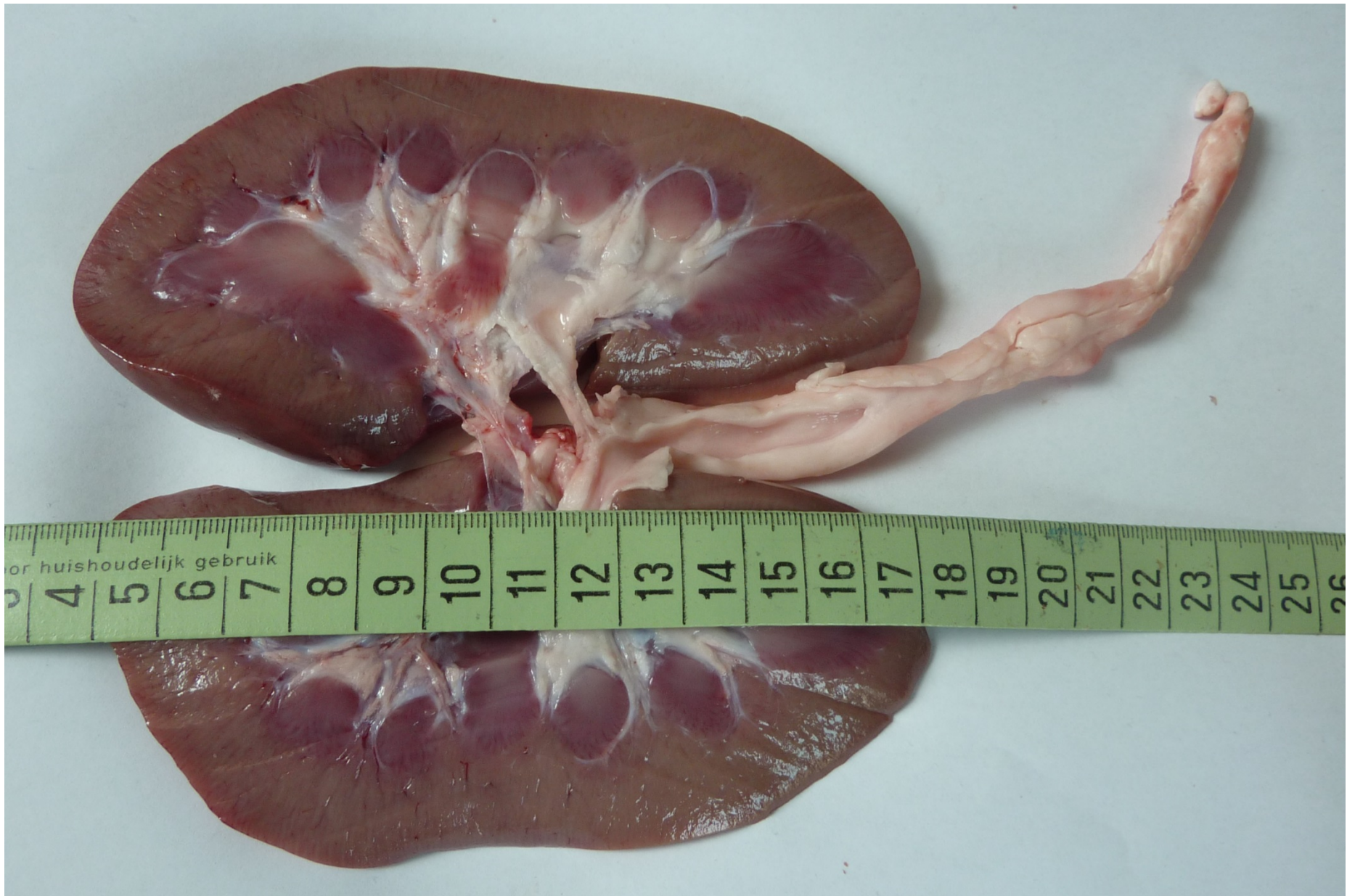
Bild: Längsschnitt einer Niere mit Harnleiter