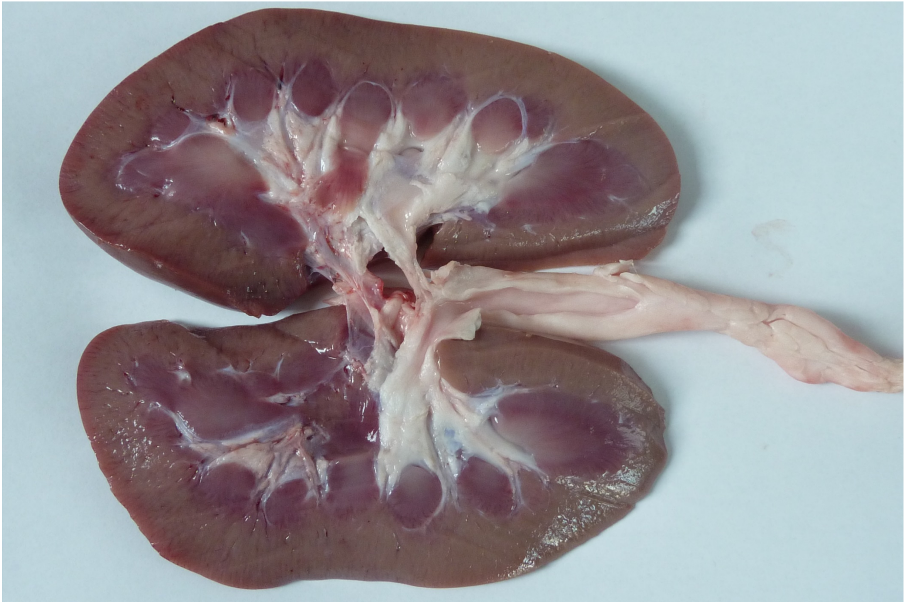
Bild: Längsschnitt einer Niere mit Harnleiter